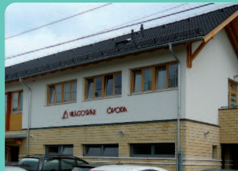
III. hely - Czepek Gyula, Győr