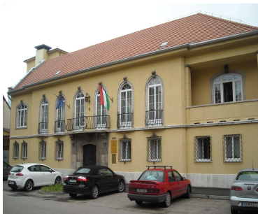
Korcsolyázó Egylet háza

földszintet, a meg nem valósult impozáns középlépcsőkart, én a képtár feladatnak megfelelő, csupa ablak, üvegtető első és második emeletet, közöttük pedig rava-szul megszerkesztett kis lépcsőházat terveztem. Ebből kicsit furcsa eredmény lett? A mai képet csúfító tűzfalak már a háború következménye: az egyemeletes lakóház elpusztulásának eredménye."