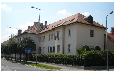
Aggintézet bővítése, Nővérszállás

Csitáry Emil polgármester az 1930-as években nagyszabású városfejlesztési koncepciót dolgozott ki, a rendezési folyamat szakmai megvalósításának élén Kotsis Iván és Schmidl Ferenc építészek álltak, hozzá Hóman Bálint székesfehérvári nemzetgyűlési képviselő, miniszter révén állami fejlesztési pénzeket kaptak. A belváros rendezésénél a bontás, építés, átalakítás eszközeivel egyaránt éltek. Bontásokkal új tereket alakítottak ki. Az Országzászló tér területének rendezési tervét Schmidl Ferenc készítette, és az Ince pápa tér (ma Bartók Béla tér) is ily módon jött létre.