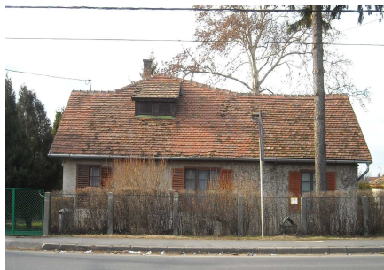
Fiskális úti nyaraló

1940-ben összeállította Székesfehérvár városfejlesztési tervét, amely a korszerű városrendezési elvek és a realitás iránti érzék jegyében készült. A megépült középületeken kívül a székesfehérvári Szőlőhegyre és a Balaton partjára nyaralókat tervezett.