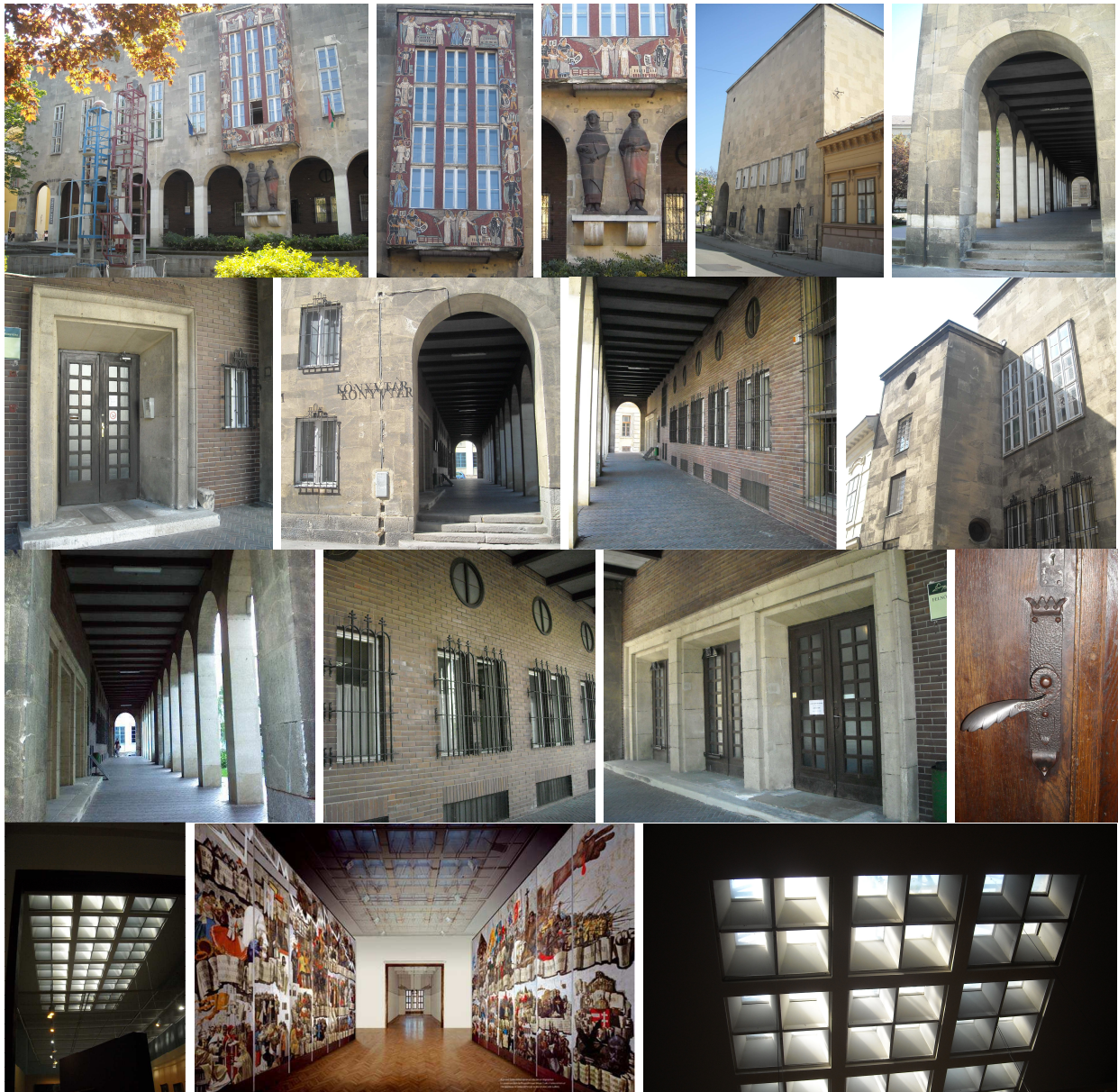
Horthy Miklós Kultúrház 1940-42., ma Csók István Képtár és Vörösmarty Könyvtár