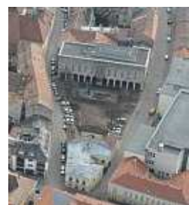
mai Bartók Béla tér

A 30-as évek elején tervezte meg a Korcsolyázó Egylet házát (későbbi Sporthivatalt) az Ady Endre utcában. 1937-ben a Bástya utcai Schmidl-ház hátsó udvarában építette fel saját házát, főhomlokzatának sarkán Ohmann Béla Szent József kőszobrával. A három évig, aprólékos gondossággal tervezett magastetős modern lakóház az akkoriban kialakuló Várkörúti villasor egyéni ízű elemévé vált.