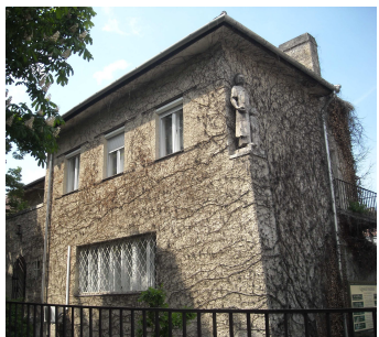
Schmidl Ferenc saját háza a Várkörúton 1937.