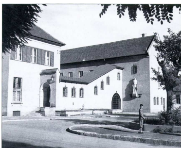
Vitézi Székház 1940-43.